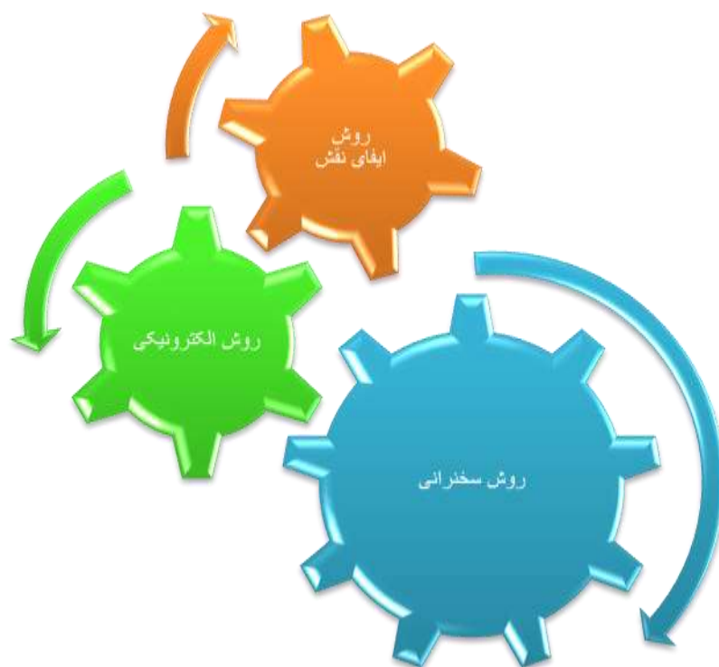
نمودار ۳ مرحله‌ای روشن‌های تدریس موثر