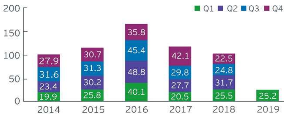
China's non-Financial ODI, 2014 - Q1 2019 (US$ billion)